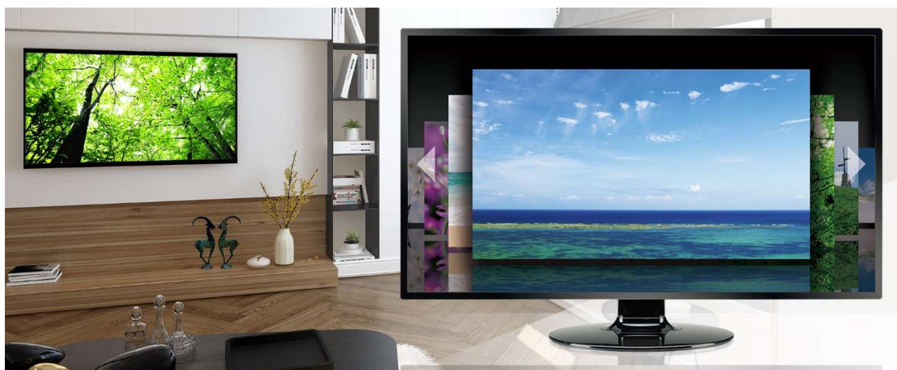
本サービス使用時の空間イメージ

凸版印刷が 2015 年より提供しているオリジナル高品質 4K 映像コンテンツと、ブロードバンドタワーの 5G に対応したデータセンターを核とする幅広い IT 技術、並びにケーブルキャストの有する全国規模の情報配信ネットワークを活かした日本全国のケーブルテレビ局へのリーチ力を組み合わせ、超高精細・高品質 4K 映像を家庭用 4K 対応テレビへ配信するサービスの提供を目指します。3 社は本実証にあたって、ケーブルテレビコミュニティチャンネルの 4K ハイブリッドキャスト(※1)上でのビデオ・オン・デマンド配信を想定し、検証を実施します。