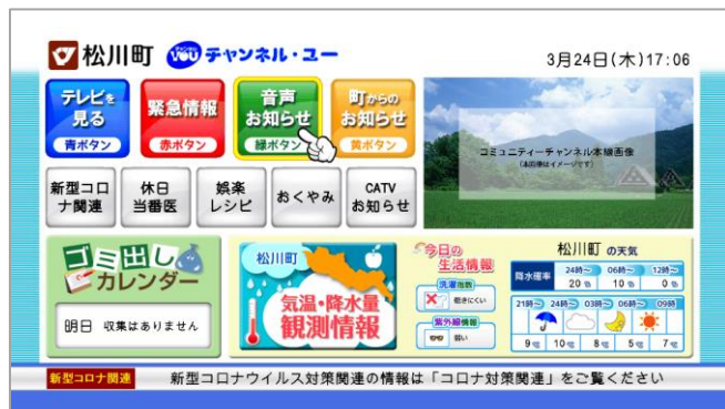
■データ放送通常トップ画面イメージ(図1)