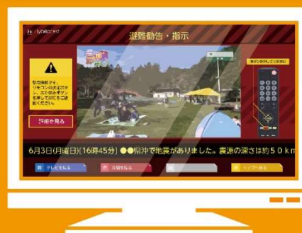
自動でハイブリッドキャストを表示